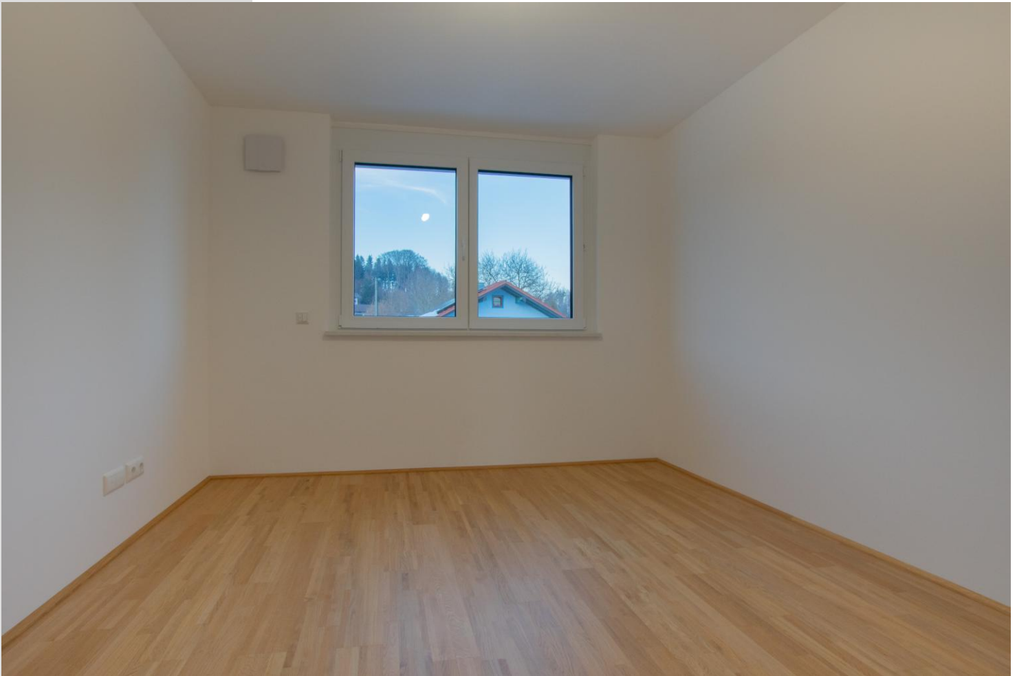
gut geschnittenes Kinderzimmer