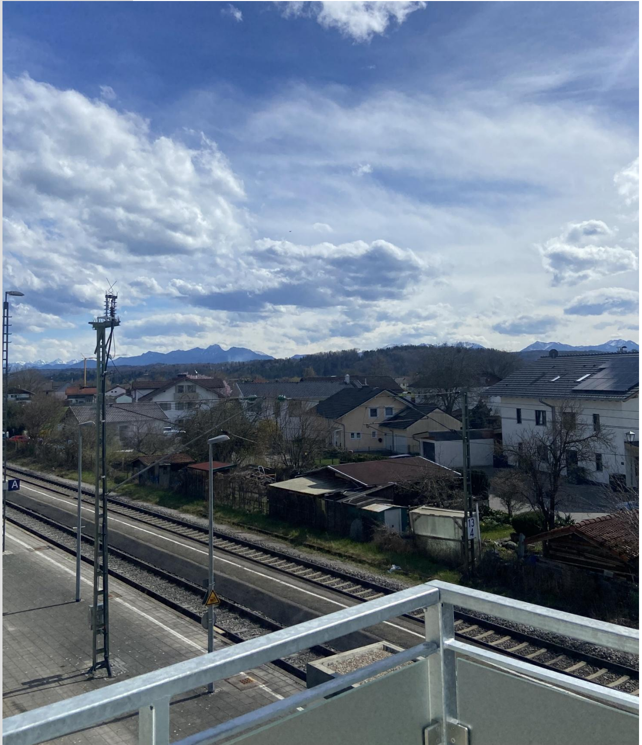
Panorama Bergblick Balkon