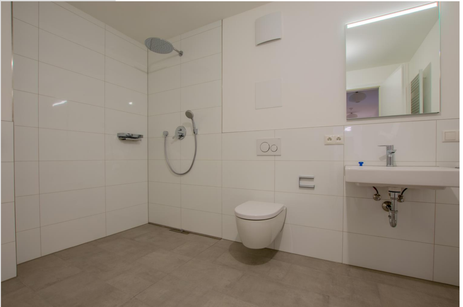
modernes Badezimmer mit begehbare Dusche